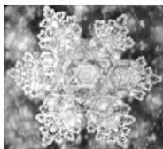
Sanbu-ichi Yusui Spring water,

Scepticii consideră homeopatia ca fiind rezultatul autosugestiei, al efectului placebo. Dar remediile homeopate sunt administrate cu succes la copii și animale (la care nu putem vorbi de autosugestie!) obținând vindecarea bolilor. Prima, și cea mai controversată teorie, care a încercat să determine bazele științifice ale homeopatiei, este cea a imunologului francez Jean Benveniste : teoria memoriei apei . Pe scurt, el afirma că moleculele de apă în care sunt diluate tincturile mamă preiau informația și energia substanței cu care au venit în contact. Poți face analiza unei dischete informatice și vei obține molecule de vinil și oxid feric, dar informația conținută nu poate fi nici dozată, nici măsurată! [7].